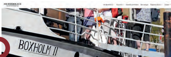
Upplev sjön Sommen

Läs mer och boka biljetter till en av sommarens turer direkt på hemsidan